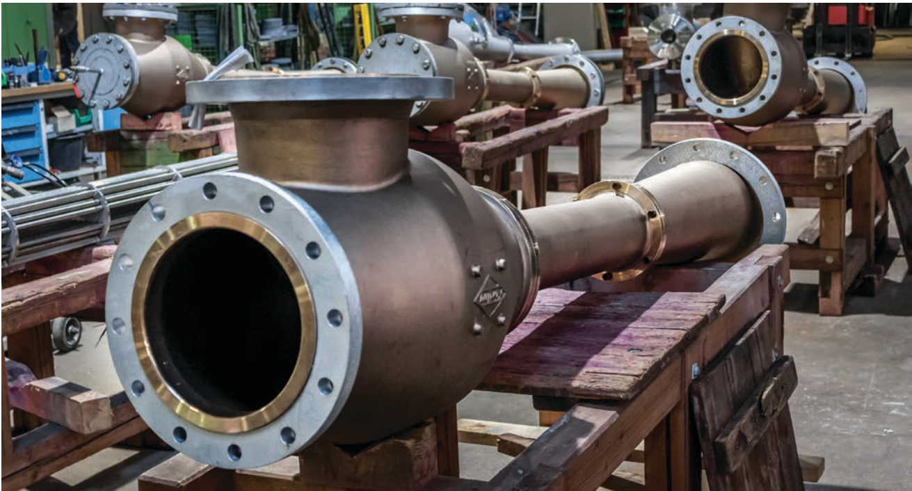
Individuelles Design: Die Strahlpumpen werden im Hauptwerk in Hannover gefertigt und geprüft