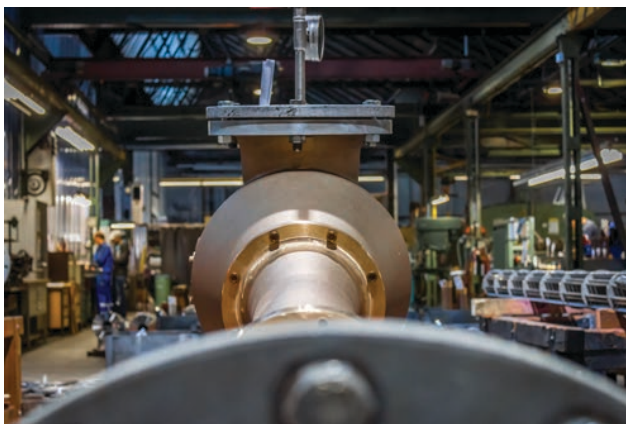
Strahlpumpe mit einer Saugleistung von mehr als 500 Kubikmetern pro Stunde

Mit mehr als 140 Jahren Erfahrung im Bereich der Strahlpumpen-Technologie bietet die Körting Hannover AG hocheffiziente und zuverlässige Lösungen für die Schiffbauindustrie. Wie kundenspezifisch diese Lösungen ausfallen können, zeigt das aktuelle Projekt für die chinesische Werft COSCO Dalian.