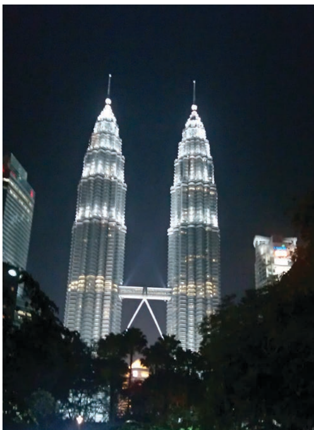
Vertrieb vor Ort: Die Hauptstadt Kuala Lumpur in Malaysia ist der Hauptsitz von Koerting SEA Sdn. Bhd.